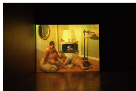
Elna Hagemann, Duet , 2009.