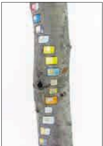
DIGITAL HUKOMMELSE: Sim-kort og seljestokk.

De henslengte stubbene og røttene er der bare, som malplassert rekved, men de er bearbejdet og alle gitt tittelen «på»; samtlige verk i utstillingen er faktisk titulert ved preposisjoner: ved, i, hos. Dette antyder den språklige bevisstheten bak arbeidene, satt inn i et meningsskapende, men også vilkårlig, system. Det tilforlatelige ved disse små ordene som forklarer hvordan noe er plassert i forhold til noe